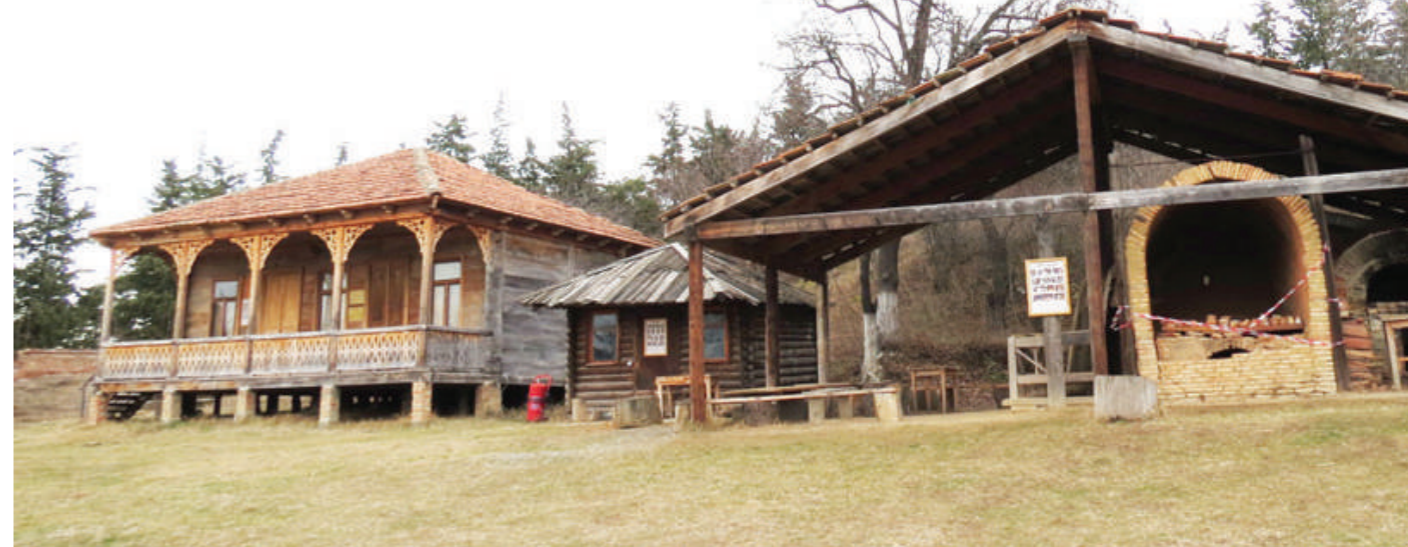
На снимке: Старый Тбилиси; рынок кувишнов в Кутаиси; часть этнографического музея под открытым небом в Тбилиси.

Во время нашей встречи удивительно мудрый старец в беседе о родном дой каждому из нас показался родным