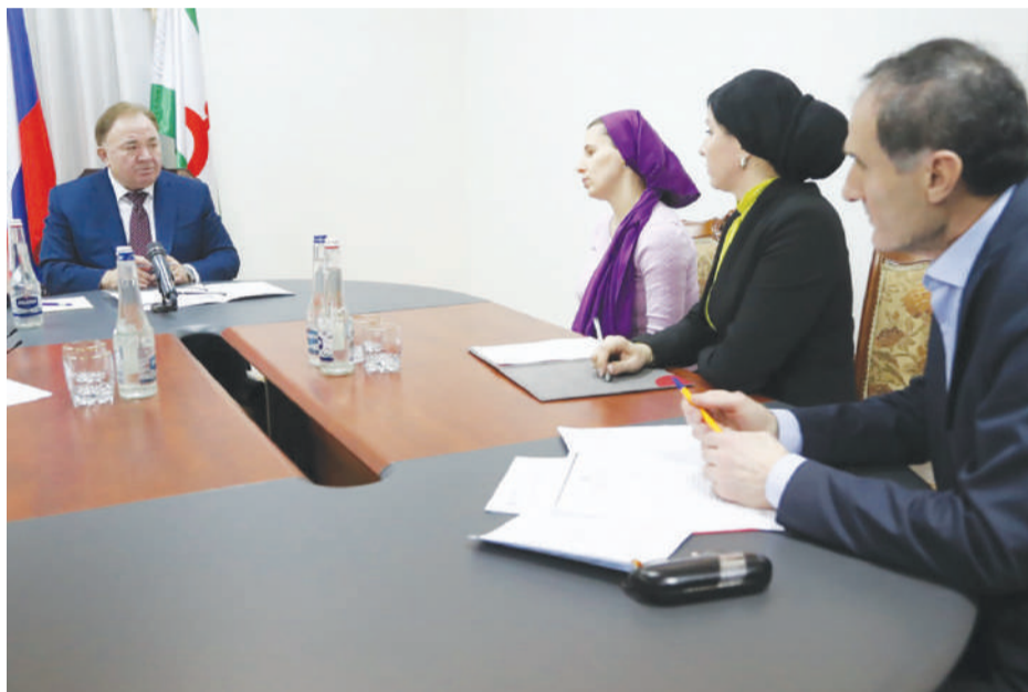
Кийчъяр КЪОАСТОЙ Заира

Бахача наьха хаттарашта терко еш дийцар, свет хьаялара кхоачам дикагІа хилийтар а, нах дІа-хъа бигара хьал тоадар а, инвестицеца ювзаенна проекташ кхоачашъяр, иштта кхыдола хаттараш а.