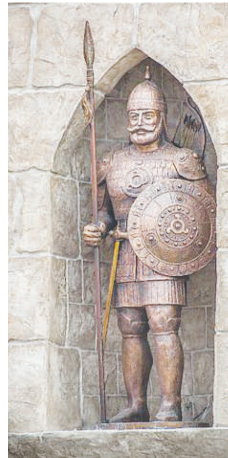
Бларзагла бараш длабъхарий, Вай бена никъ чакхбаьларий?

Дахчан пандар хьабаьккхарий, Аьрдаглабараш совцабирий?