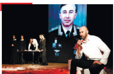
СИЙДОПА НИКЪ Турпалхо дагалаьцар театро