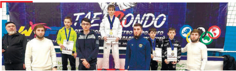
СПОРТ ГалгIай спортсменаш тхэквондох котбаьлар