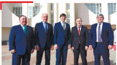
ЮКЪАРЛЕ Балха гIулакха аьдагIий болча вахав Мехкада