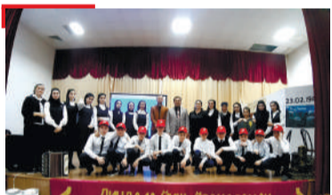
БАПАН ДИ Долакха-Юртарча ишколе хилар, «Халкъа Іаьржа таьзет» яха кхетаче