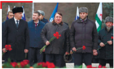
МЕХКА ВАХАР Россе Президента никъ хъаллоац

Газет арадувл 1923-ча шера бекарга бетта 1-ча дийнахъа денз 1973-ча шера «Сердало» газета «Знак почета» яха орден еннай