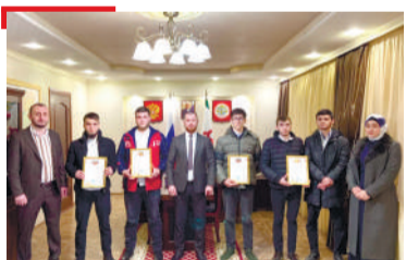
ХАТАР Туркий, Шаьме мехкашта гIо деш хиннараш