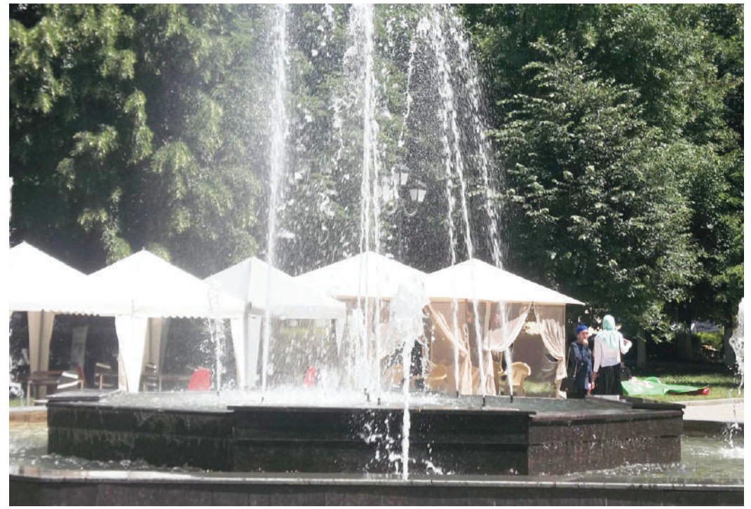
Наступило лето с его изнуряющей жарой, и горожане, устав от безотны и духоты, ищут где бы присесть, передохнуть, выпить живительные прохладные напитки. И такие места в Назрани есть.

Р.Б.МЕДАРОВ, заместитель начальника отдела защиты растений филиала ФГБУ «Россельхозцентр» по РИ