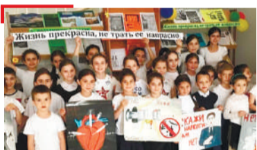
КХЕРАМЗЛЕ ПалгІайчен Назранерча района дешархой наркотикашга духъала