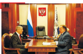
ЮКЪАРЛО Чайка Юреи Келматанаькъан Махьмуда-Іаьласи кертгера хаттараш дийцар

1973-ча шера «Сердало» газета «Знак почета» яха орден еннай