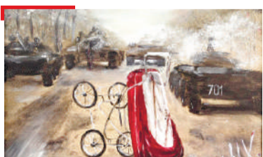
МУЗЕЙ Хучбаранаькъан Маринас, ПалгІайчен исбахъален музее, ше дилла ши сурт дІаденнад