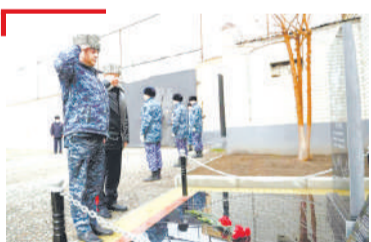
ДАГАЛОАТТАМ ПалгІайче даима дагалоатторгйолаш йир, Къилбаседа- Кавказе байнача, бокъонаш лораяра болхлой цѳераш