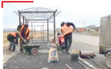
НАВКЪАШ «Зязиков-Юрт- Горагорск» яха машинникъ тоабеш латт