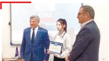
ПРОЕКТ ПалгІайчен студенташа дакъалаьцар Россе Конституце Денна хетаяьча «РосКвизе»