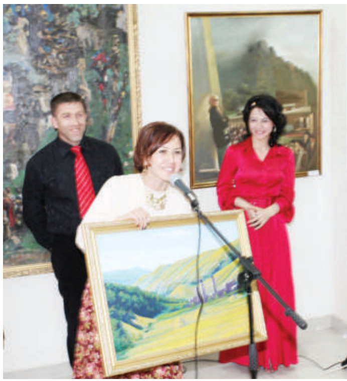
В рамках реализации указа Президента Российской Федерации «О мерах по реализации государственной политики в области культуры и искусства, развитию культуры народов Российской Федерации» Государственный музей изобразительных искусств Республики Ингушетия провел выставку живописи, графики и декоративно-прикладного искусства Ингушетии «Край башен и легенд» в Кабардино-Балкарском музее изобразительных искусств им. Ткаченко.