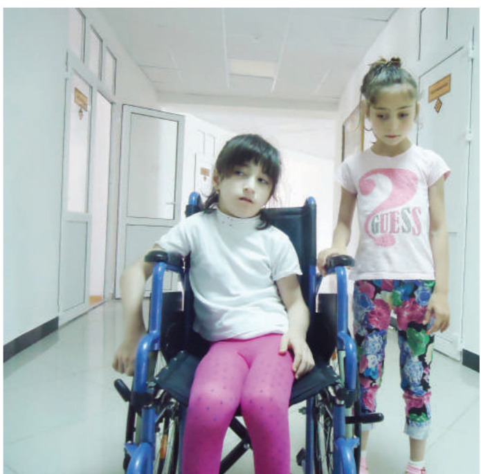
от моей протянутой руки.