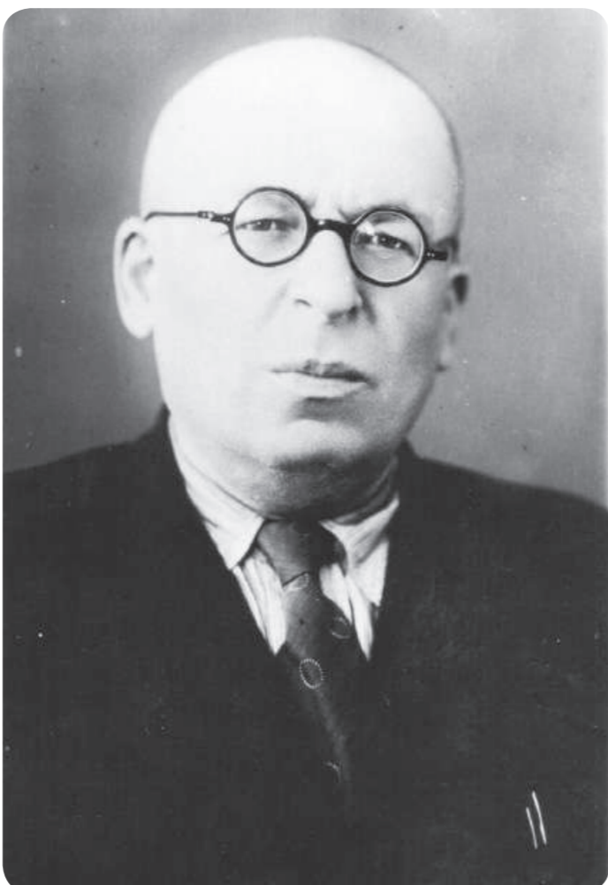
Уж гучабаха. Цар караерзаяь х1анзалца шоаш ца лелаьр жу – фельетон.