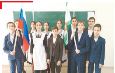
КЪОНАЧАР БОЛАМ Хьалхарбарий мугI шербелар