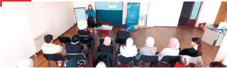
ГЮНЧИЙ Наха гю деш леларий балхах дийцар кхетаче