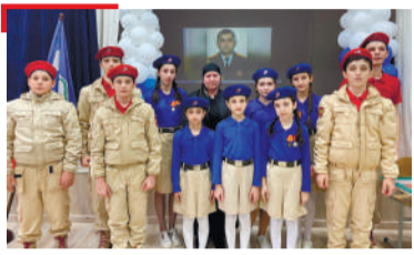
ТИМХОЙ Йицлургйоаца ци

Газет арадувл 1923-ча шера бекарга бетта 1-ча дийнахьа денз 1973-ча шера «Сердало» газета «Знак почета» яха орден еннай