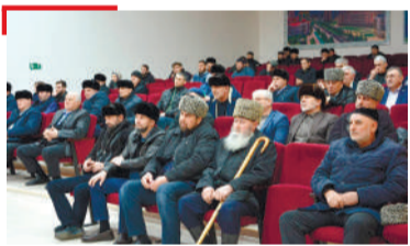
ЮРТАРА ВАХАР Гпажарий-Юртарча бахархой кхетаче хилар