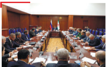
БОКЪОНАШ ЛОРАЯР Галгйайче хатараш хилара бахъанех цаI да, водителаша бокъонаш телхаяр