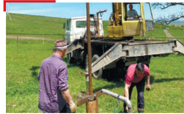
КЪАМАН ГЮЛАКХАШ Хин гюлакх тоадир лоаман юрта