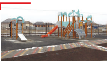
ДЕШАР Кердача ишколо кастга ший налараш хьаелларгья