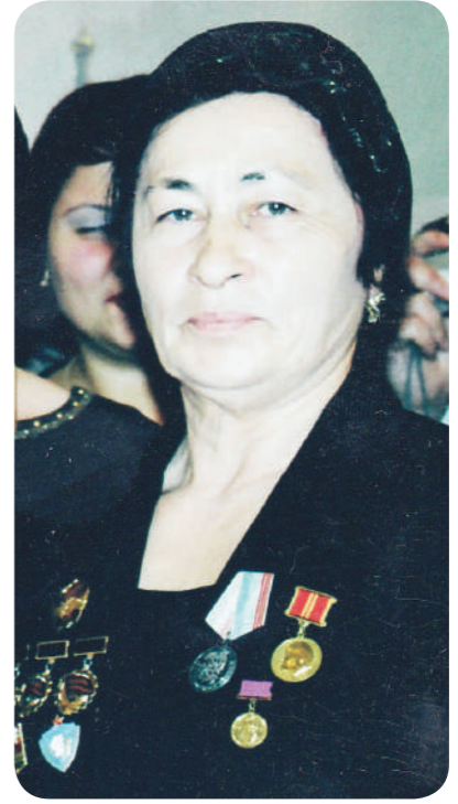
вალась помощь, он был радом.