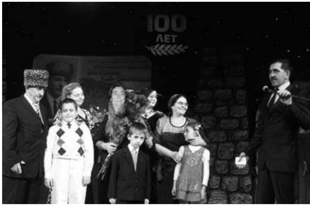
тепло жить. Хочется сказать огромное спасибо Главе республики Ю.Б.Евкурову,