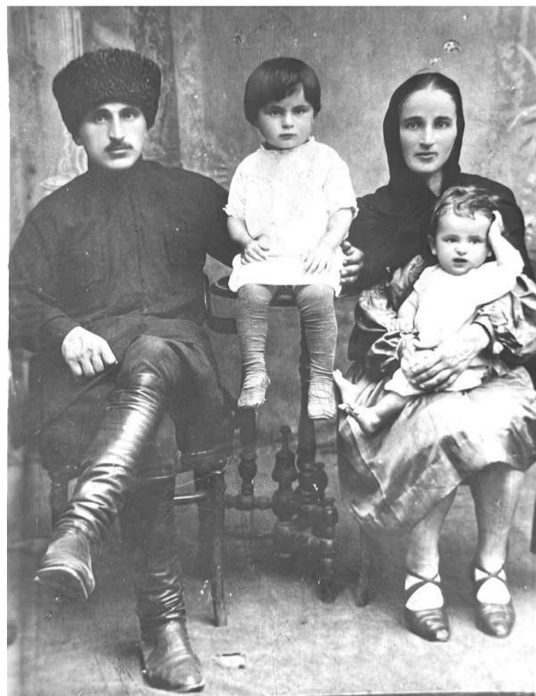
Махьмади цун хьалхара фусам-нана Дидигананькъан Марети - берашца.

Садала Махьмад ваьхар 77 шера, из кхелхав 1979 шера. Цун фусам-нана Лаьнананькъан Фади яхьай 2001-ча шерга кхаччалца. Шаккхе длабехкаб Махьмада дай баьхача Насар-Керте.