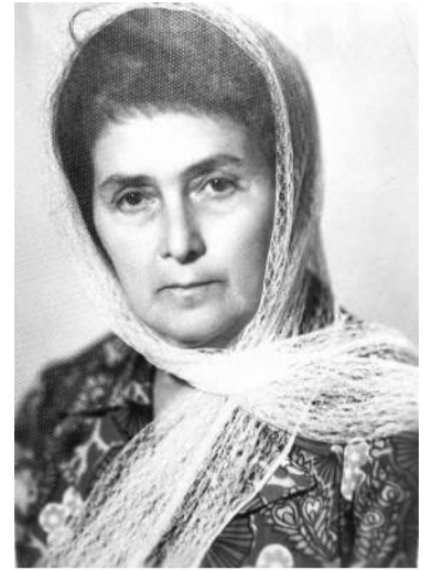
Махьмада шоллагъа фусам-нана Лаьнананькъан Фади.

1971 шера шоаш Насаре цабаьккача, ше пенсе вале а, балха отт из. Цхьаннахьа балха боацаш, цагъа багъа йемача нахах саг хиннавац из. Юхьанца из балха длаэц цу хана хьинаре къахьегаш хиннача Насарен трикотажни фабрике, ЖКО кулгалхо волаш. Фабрика доалахьа дуккха хлама дар цу заман чухьа. Кладаш хьадеш, цхьац цу барзкъа тегаш хиннача фабрикан болхлошта квартираш телар, лаьрххла фабрикан