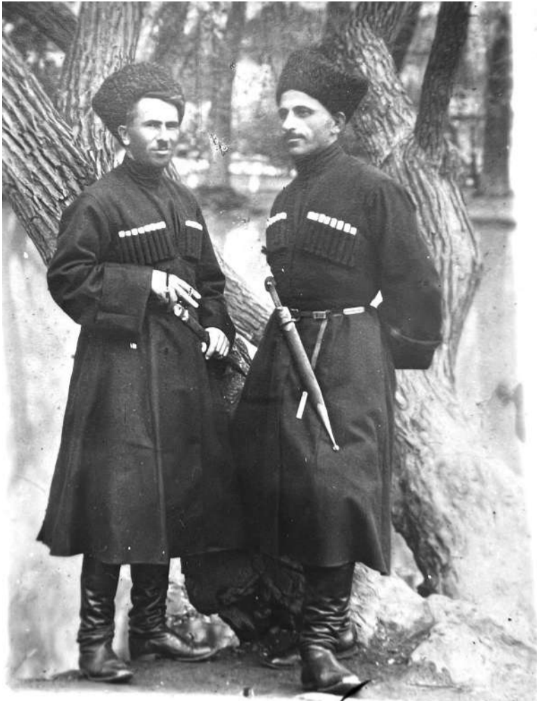
Солтамананькъан Махьмад - аьттехьа латт.

дешар дийшад, Москверча Н. В. Склифосовске церагъа дарбанче медвоша волаш къахьег цо. Ростовски облесте эскаре амал деш а хиле, цул тлехьагъа Москверча физически культуран спорте институт йоаккх. Ялх шера Насаре берашта дзюдо Юмаеш хул.