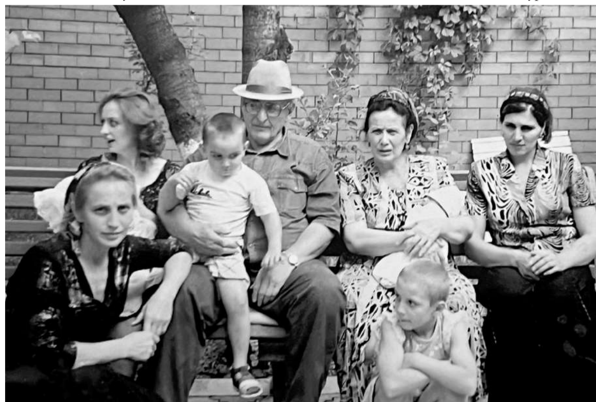
Муса ший дезала юкье

Цигара араваьнна, Ленина урама сеьхаваьнна, вIаштIара даьча цIен наIарга хьалтега йоаккхача цу цIагIарча балха моттигашка хьежа эттав зIамига саг. Цу цIагIа, сона дагадоагIаш, со студент волча шерашка «Сердало» газета ре-