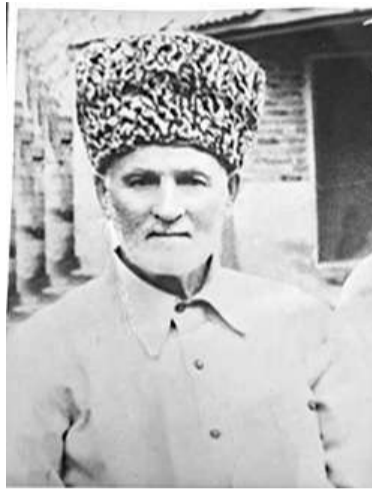
Хидиранаькьан Эсолта Осман

Дукхабараш тахан а лохаш ба шоай гаргара нах. Царех ва Хидиранаькьан Бахьаудина