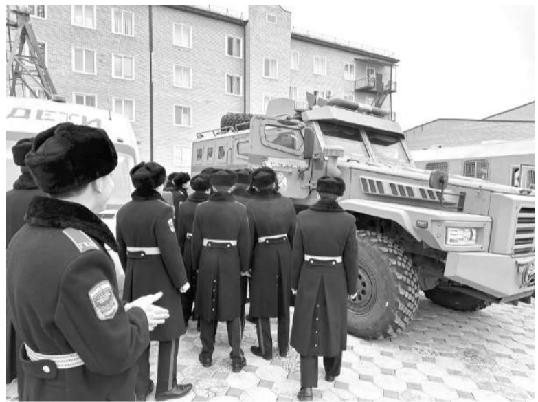
Росгварди хьакхолларах, тIема гIирс лелабеча нахах лаьца; цар турпала, денала, майрала наькъаш го йиш хилар. Цу дувцараша берашта йицлургIоацаш йир из кхетаче.

Йийлла наIараш яха кхетаче дIахьош, дешархошта дийцар