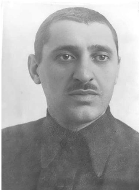
Овшанаькъан Йовмарзий Махьмад

Со кхувш воагӀа хана, Наьсаре тхона юкье даьхача берий дукха дезача ловзарех цаӀ дар бийнаш деттаргах латар. Белгала дагадагӀац сона, тхоай коа боксёрий кулгахйоахкоргаш мичаьхьара енаяр, мора бос а болаш, тӀиргаш етташ бертера дӀа а ехкаш, ши пара кулгахйоахкоргаш яр тха коа. Тха наӀарга делкӀинга е сарахьа гуллора бий чоагӀагӀа хьан тох хьажа ловш бола ондаргаш. Хийла со а лийтав иштга, цкъаза бий кхийтача, благоваоагӀаш а нийслора. Цу хана бокса секцеш яцар вайцига.