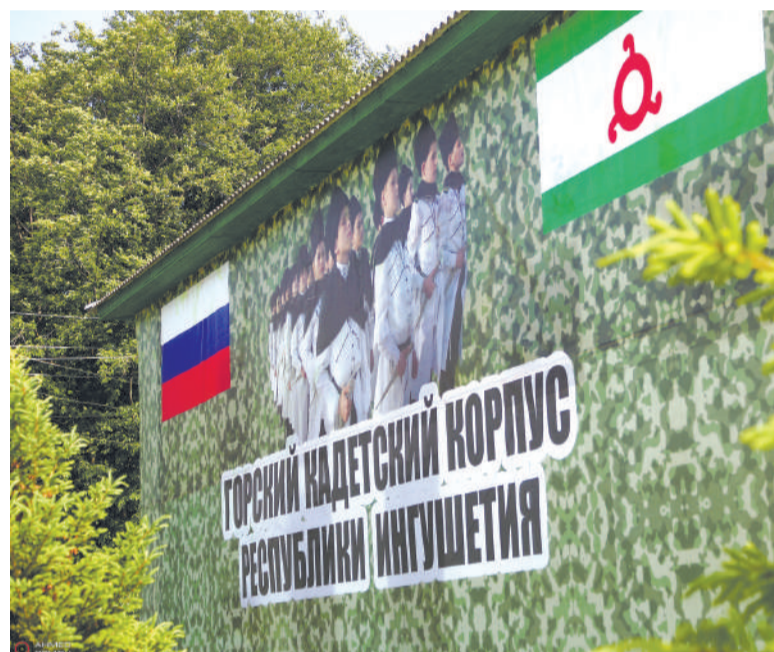
Лоаман кадетий корпус

наъкъан, Хучабаранаъкъан, Албохчанаъкъан, ТIумхой, кхьыбараш. Укх шера, юрт йиллача денз, 165 шу дуз. СурхотIе йилла хиннай 1859-ча шера. Цу юкъя дукха хувцамаш хиннад цун лаьтта, дукха дика нах баьхаб, хIанз а бах.