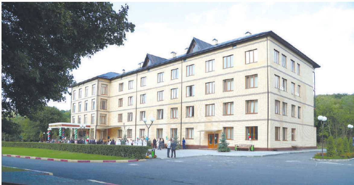
ТIема, къахъегама доакъашхой цIа-дарбанче

Ший Iаламга диллача, хозача моттиге улл ГIалгIай мехка къаьнагIчарех цаI йола юрт - СурхотIе. Укхаза да гувнаш, аьлеш, даьгIенаш, доагIа хиш, хъасташ, хъунаш, кхьыдараш. Карарча хана, цун доазонашка бах дукхаца тайпаех хъабаьнна нах: Овшанаъкъан, Муцолганаъкъан, Налганаъкъан, Исмейланаъкъан, Булгучанаъкъан, Белхарой, Матенаъкъан, Даканаъкъан, Гарчакханаъкъан, Курскенаъкъан, КIаражанаъкъан, Меданаъкъан, Тоачанаъкъан, Дошхъакхалой, Эсе-