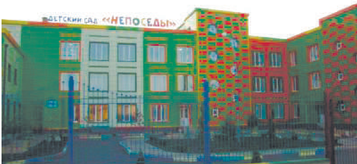
«Сатем боацараш» - берий беш.

Хоза а дегIа салолам хулаш а дегIаюагIа СурхотIе. Цигара нах хIанз мо барт болаш, машаре хуле, кхы тIа а нах цецбаллал эргаяргья из гаргарча шерашка, хIана аьлча цига я хъалиолаь, нах паргIатабоахаргбола гIишлош.