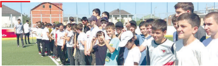
СПОРТ Унахцѐнача вахарга хлама кхоачаргдац