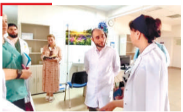
УНАХЦІЕНО Дарбанчешкара хьал тохкаш да