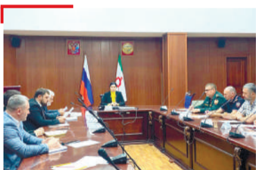
ХА ДЕЗАР Кхерамах лорабала Юмалургба, вай мехарча ишколашка