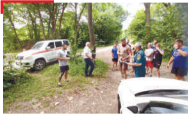
КХЕРАМЗЛЕ «Мужече» салолаш дола бераш, хих лорадалара тІахьийхар

1973-ча шера «Сердало» газета «Сийлен хъарак» яха орден еннай