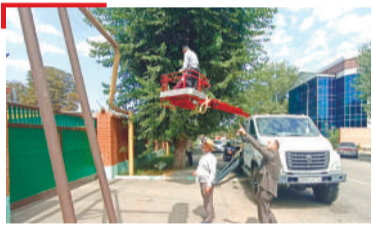
ДЕЗА ДЕНОШ ХьатІадоагІача цІайга кийчо еш ба Илдарха-ГІалий тІа