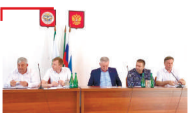
БОКЪОНАШ ЛОРАЯР Наха низ беш леларашта духьала, де дезарех дийцар МагІалбике