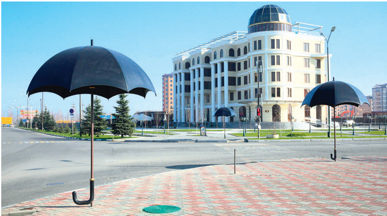
Сурта тIа: Магасера чaьтараш (зонташ)