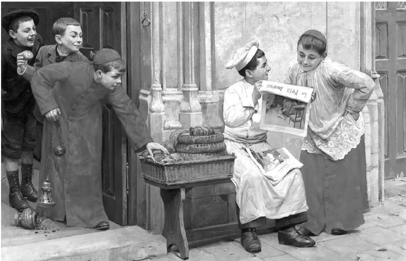
Поль Шарль Шоканр-Моро «Зіамага кю»