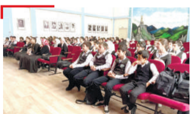
ДИН ХЪЕХАМ Наьсарерча дешархошца, кхетаче дайихьар дийшача наха