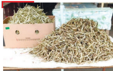
БАЗАР 1200 сом даьккхача хьонках, тахан 900 сом доаккх