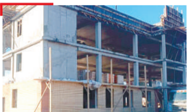
ГИШЛОШЪЯР Наьха хьашташ кхоачашдарах бола болх тоабеш латт вай мехка