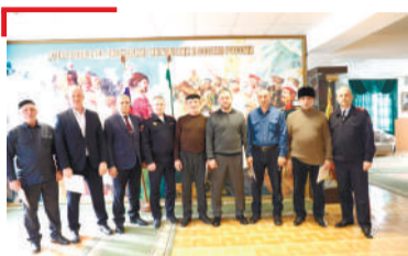
НАЪХА ХЪАШТАШ Бокъонаш лораерашта, кердача квартирий дьоагIаш дIаделар

1973-ча шера «Сердало» газета «Сийлен хьарак» яха орденна