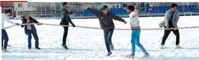
ДЕШАР Гаьнара баьхкача студентий хьалхара Ia