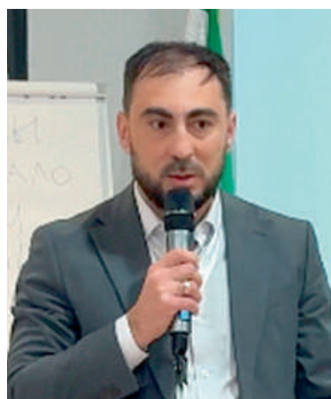
Абаьданаькъан Ислам ва ГалгIай Республикан Кулгалхоцун, Паччахьалкхен Администраце болхло