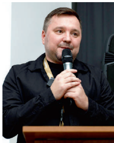
Мазяков Евгений «Машук» яхача «дешара центра АНО программни совета кулгалхо ва