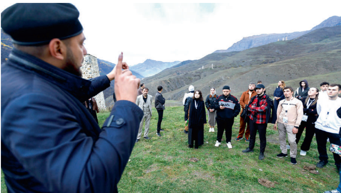
Гида дувц, Аьрзе исторех лаьца