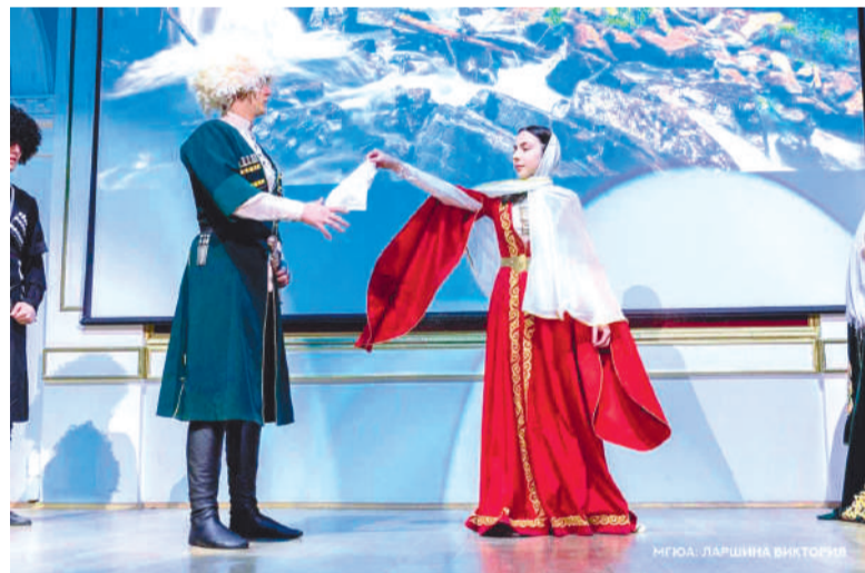
та хьалхашка оттадаь декхаш хьохачашдеш, нийса никъ дIахьош бола кагирхой вай хилар.

Тхона гуш да, ГалгIайчен доазол арахьа дешаш болча вай студенташа дика толамаш доахаш хилар. Уж, шоай дешара терко тIайохийташ, вахара нийсагIа йола оагIонаш лелаш, хьабоагIа. Хоза хет, шоаш-