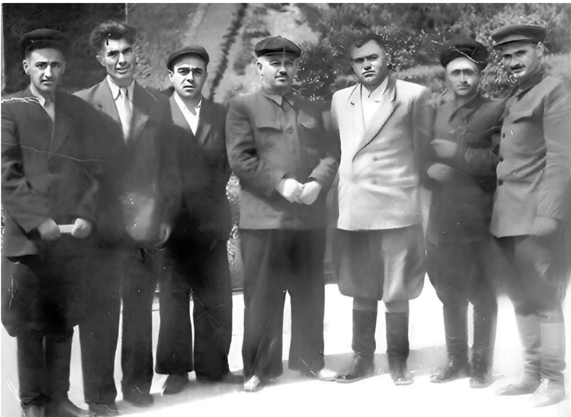
Найсарера цѣхеза нах, аьрдехьара кхоагала латтар Оздой Муса