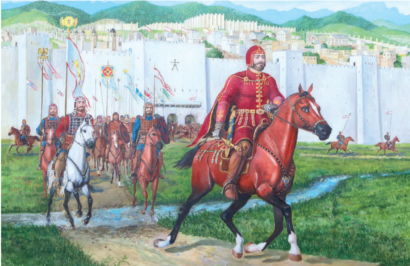
Имагожанакъан Х-А. «Аланий паччахъ»