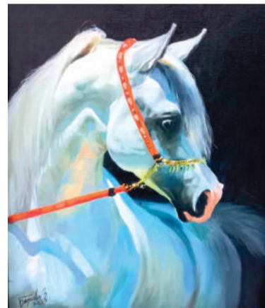
Блазенакъан З. «Гарбий дын»

Наьсаре а кхыйолча шахъарашка а говраш хӀанз кӀеззига гургъя е вӀалла гургъяц. Амма сел дукха ха яц укхазача керг-