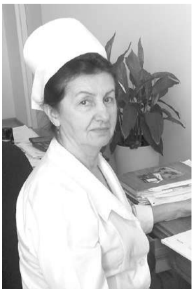
Пхилексонгий Абсет - лор

Уж балха боацаш, цар хьинаре къа ца хьегаш моттиг лаха хала да вай республике. ГалгІай кхалнах дикка гаьнабаьннаб Іилманча, культураца, литератураца, хІама кхоллаш йолча моттигашца балхаш деш, доккхий толамаш доахаш. Цьаьдола вахара доакьош цар хьинарах лелаш да. Масала, карарча хана вай берий бешамаш, ишколаш лелаераш дукхагІа даькъе кхалнах ба; дарбаш деш йолча унахцІенон фушамашка наггахьа мара гуш хилац маІа саг, наьха могашал хьаллоаттаераш, чоалханеча, кердача лорий гирсаца болх бераш уж ба; библиотекаш, культуран цІенон цар къахьегамаш тийша да; вай хІара денна буаш бола кхача цар кийчбу, кхы а дІаблаьхбе йиш йолаш ба из мугІ.