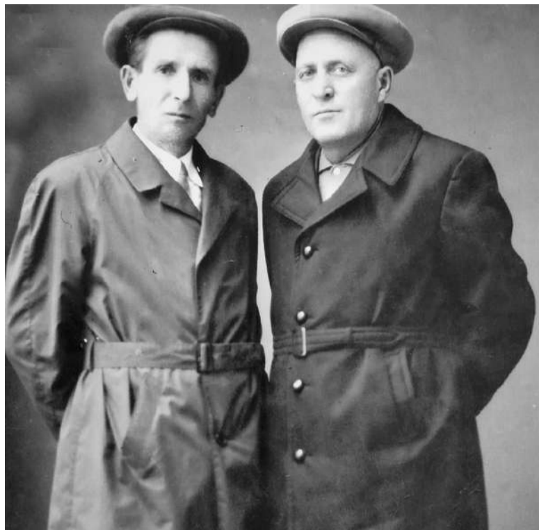
Сурта тла: (аьрдехьара аьттехьа) Гарчакханаькъан Контора Яхььяи Алсбика Султангири

Юххера а, уж лайтташ Конторагара дладоах, из ше Ахкий-Юрта длавода ваха. Хетаргахьа, Наьсар-Керте цунна цъха да вахал мара хлама дита хиннадац. Цига ваха висав во! Ше ваха хайнача кердача моттиге а, сомий беш длаегаш хиннай дезала дас. Бакъда длахо гюза а паргата а вахар хилац цар, шоай дай баьхача лайтта. 1944 шера мехкахбоах галглай. Сибре Юбугача хана, къаьст-къаьста бига хиннаб Ахкий-Юрта ваха Контори Наьсар-Керте леш вола Яхььяи, цун веший Японций дезали. Наьсар-Кертерча атагаш, хланз «Долина смерти» оалача моттиге, цу юрта мел вола къонах хьагулваьв. Цига хоам баьб мохк бохабеш хиларах, цигара машинаш тла ховшабаь, шоаш длабига белча къонахий тохабенаб. Чоагаша хлама ма хиннадий царна тлакхеллар. Герзех бизза хиннаб эскархой. Гув тлара Ючутехача пулемето цига лозаваь хиннав Контора Японца. Цу дийнахьа длавигача глоне, де доацаш вайна даваьннав из. Юхьанца лорашка длавигов из, амма кхы ценах кхетийтавац. Хетаргахьа, яьча цленхаштарча човнех кхелха а хила тарлу. Вошас Яхььяс ший хур даьдар из лаха, цунца хиннар фуд хьажа герташ, амма цох пайда хиланзар. Хьалаца дух доацаш, чакхдаьлар из гулакх. Из моттиг яйна-