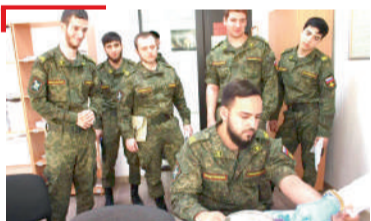
ДИКА ГІУЛАКХ Ерригача Россе донорски болам хъаллаьцар ИнгГУ ВУЦ курсанташа, эпсараша