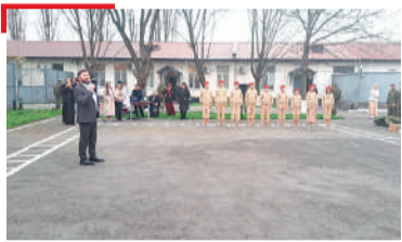
ТИЕМА ДЕКХАР Галг'ай мехка лаьрхх'а накъабаьхар, эскаре амал де болхараш