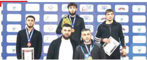
СПОРТ СКФО ММА Чемпионат, халхале яккхара яхъаш д'айихъар Наьсаре