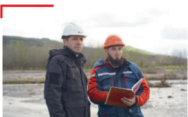
КХЕРАМЗЛЕ Россеташа т'ахъожам лоаттабу, хий чудалара кхерам болча Галг'айчен моттигашта