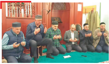
НОВКЪОСТАПА КУЛГ Халача хъале этгача Селий мехкарча наха, 1 млн сом ахча дахъийтар Санкт-Петербургерча г'алг'аша