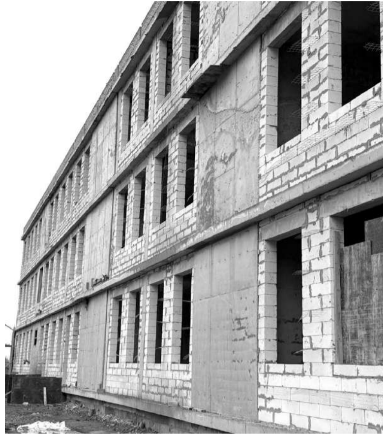
истеяккхар. Галашка баха нах чIоагIа дезаш бар из гишло сихагIа хьалгьеш ялар. Цар белгалду, керда ишкол хьалгьяро юртара вахара хьалаш а тоадергда.

Гергача истола кепара дIахьош долча кьамаьло таро лу отчIташ чIоагIе, иштта хьалхашка нийслуш дола хаттараш сиха кхоачашде. ДIахо цхьана болх дIабахьара хоадам болаш хаттараш хьакьоастадир, гишло шоаш аьннача хана