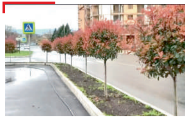
ШАХЪАРА КУЦ Галг'айчен доал деча дакъ т'арча архитектуранна, доазув баьцардерзадара терко лоаттаю