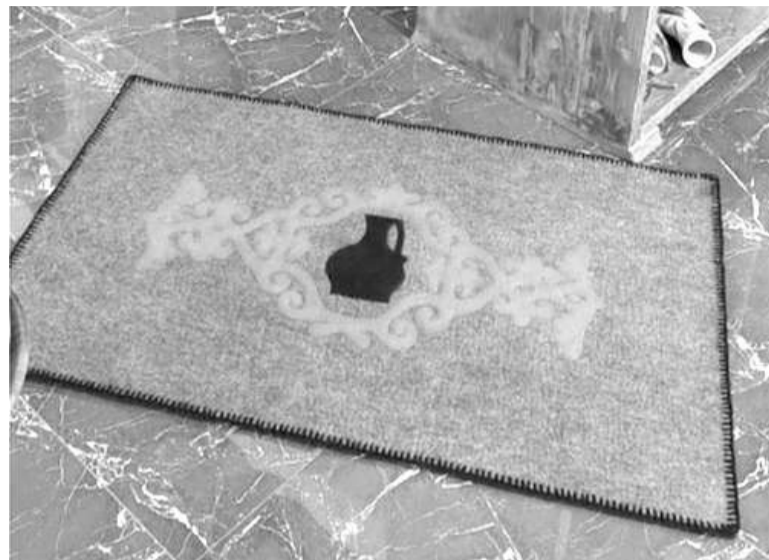
Хамченаькъан Гашата кӀувс

Говзанч-хьехамаш вайцига бе-бе лостам болаш ду. Масала, топпарах хӀамаш хьаеш хул цьхадараш, вожаш аьшкапхьара говзал Юмаеш, тхак ферта еш, гизгех хӀама кхоллаш. ГӀалгӀай исбахьален цьханкхетара юкье 162 пьхар ва, цар ду балхаш а вӀаший тара доацаш, эргаш да. ДӀахо дӀайодача хана пӀабраска, шоатта денош-