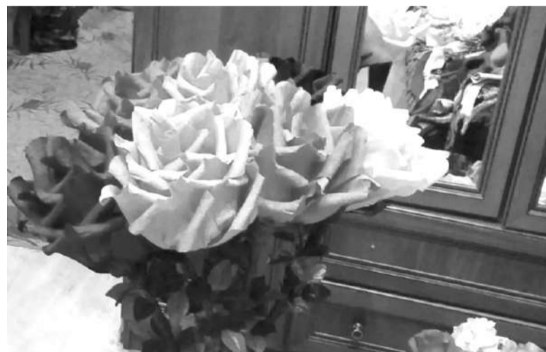
Тиймарзанаькъан Аьсета болх

ДӀайолаеш из моттиг Магасера йолаьаьле а, дӀахо дӀайодача хана, ЖӀайрахье а, МагӀалбике а, Шолже а, Илдарха-ГӀалий тӀа а е лерхӀ цу тайпара майдаш. Цу моттигашка бахача пьхарашта хьабахка а шоай болх дӀабахьа а атта хургдолаш. Цунга гӀолла республике хьаухача хьаьшашта, туристашта вай кьаман культура, пьхоарала тайпаш дикагӀа дӀадовзаргда.