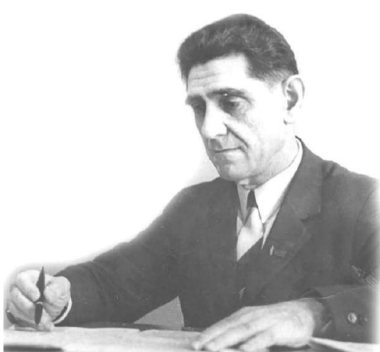
Талмача баллах воалл деша говзанча

3) 1948 шера наджгоанцхой бетта 1-ча денга кхаччалца – Ошски райисполкома мехках-