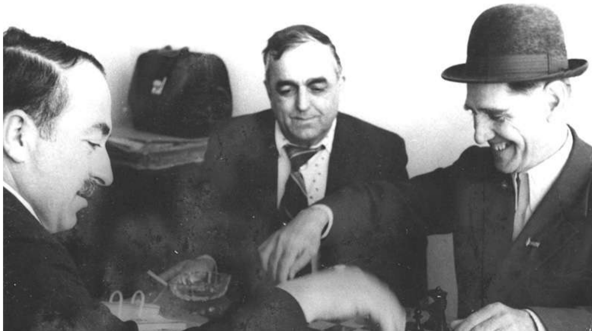
Делкьинга ж'акех ловзаш

1937 шера балха говзал лакхье вохийт из Москве. Кертерча банке кхач бетта курсашка хиле ц'аваоаг'а. Кредитех волча инспектора г'юнча хул Ахьмадах х'анз. Цу шера наха юкье дешар доражадара, дешанза хилар д'адаккхара хьакьехьа амар арадоал.