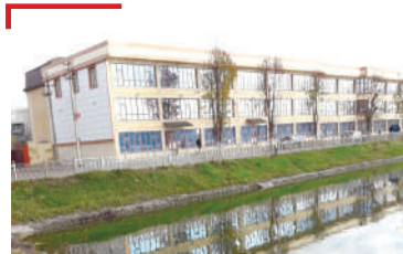
УНАХЦІЕНО Хин хьалага хьожаш хилар лораш