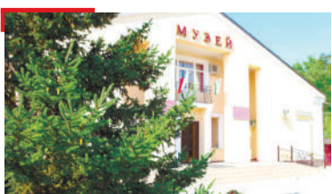
КУЛЬТУРА Музее баъча балхага хьежар министр