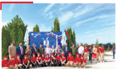
ДАГАЛОАТТАМ Палг'айче боабъ нах дагалувц