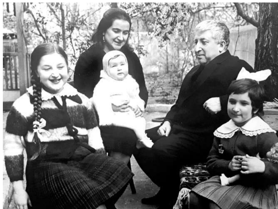
Гамзатов Расул ший дезалца