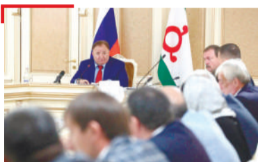
МЕХКА ВАХАР Боккхача накъба Гулакхаш

1973-ча шера «Сердало» газета «Сийлен хьарак» яха орден еннай