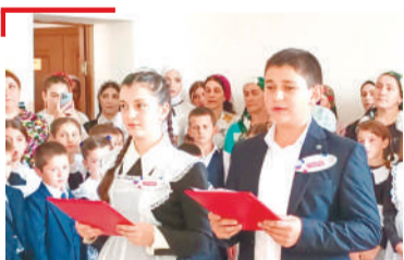
БЕРИЙ ДУНЕ Хьалхара гургал бийкар