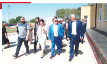
ГИШЛОШЪЯР Палг'айче хьалтью керда дарбанчеш