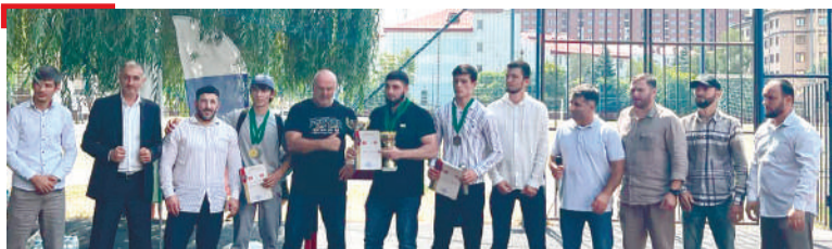
СПОРТ Спортацара марафон д'айихьар Магасе