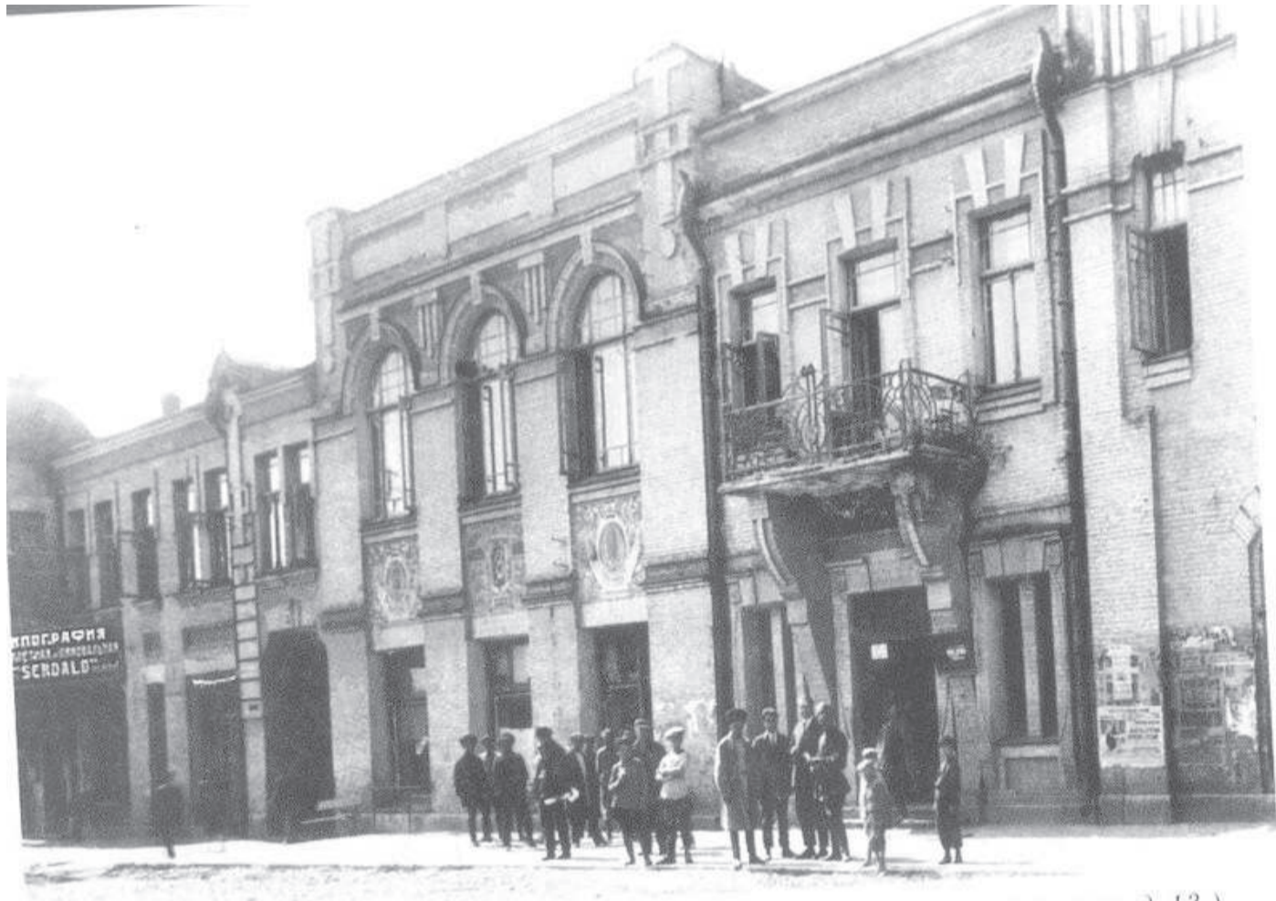
Здание типографии "Serdalo". 1926 г. (Владикавказ, ул. Максима Горького, д. 13.)

бола нах, ханашка бийрза е бокхий нах ба аьнна, ала доагӀа. Цар яхачох, газет дешаш ба уж, дукхагӀа культура гулакх довзар е керда мехкаца хоттаденна хоамаш хар духъа. Геттара дика хет царна, кердача хана йоазув юха а галглай меттал далар. Вешта эрсий меттал арадувла кепатохар а деша цар, шоаш цхъан хана юмабаь мотт биц ца балийттар духъа.