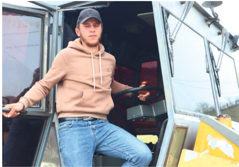
Каток тIа болх беш вола Пхьиденаькъан Масхуьд

наша новкъарле ергIоацаш, ханна йола гIармаш (знакаш) оттаяьр наькъахоша, бакъ-