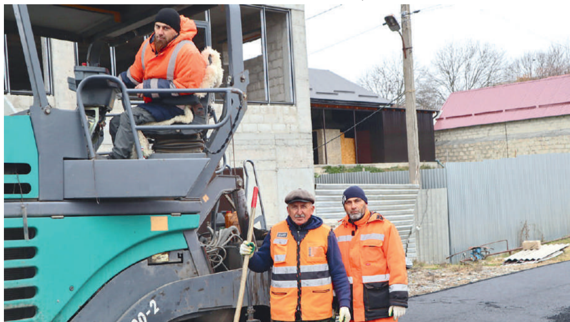
Асфальт Iобуллаш лела БасхановгIар Салмани Сулеймеи, Чимхьилгананькъан Хьасан (бел бейоаллар).

Iомаю ишколе 7-ча классе дешаш долча бераша. Къаьстта а ахкан хана цар къахьегам хала ба аьнна хет сона, хIана аьлча Магасе эггара бIайхагIа болча бетта болх беш боахка кагийнах а царна хулаш йола хало а яйнай сона. Цудухьа воаш новкъа долхаш-доагIаш уж дагалоацаш, царна баркал оалаш а маьл кхайкабеш а хила деза вай.